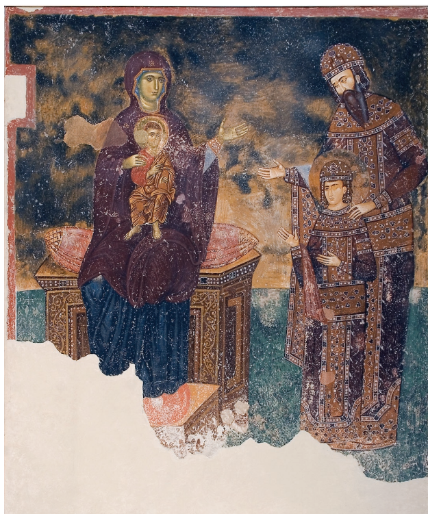
Εικ. 18. Ο βασιλιάς Στέφανος Ούρεσης Α΄ με τον γιο του, αντίγραφο τοιχογραφίας, τέλη 14ου αι. Βελιγράδι, Εθνικό Μουσείο, αρ. ευρ. 1322.

προαναγεννησιακών χρόνων. Ο επισκέπτης συνειδητοποιούσε τη δυναμική αυτής της αλληλεξάρτησης ως προς τη σχέση της με την Αναγέννηση, θαυμάζοντας τους τεχνικούς, θεματικούς, μορφολογικούς και χρωματικούς προσανατολισμούς ορισμένων δημιουργιών, τις οποίες σημάδευαν οι τρόποι της λεγόμενης maniera greca : για παράδειγμα, ένα δίπτυχο της National Gallery του Λονδίνου με την Παναγία και τον Χριστό, έργο κάποιου ζωγράφου από την Ούμπρια του 13ου αιώνα, ή την αμφιπρόσωπη εικόνα της Καστοριάς (εικ. 15). Στην ενότητα αυτή ήταν εντεταγμένες και οι μνημειακές μπρούτζινες πόρτες από τον San Salvatore de Birecto στο Ατράνι, που είχαν παραγγελθεί τον 11ο αιώνα στην Κωνσταντινούπολη και που ανέλπιστη τύχη επέτρεψε να συμπεριληφθούν στο υλικό της έκθεσης (εικ. 16). Το ίδιο μπορεί να υποστηριχθεί και για ένα καλοδιατηρημένο ταφικό ύφασμα του όψιμου 13ου αιώνα από την Κύπρο που βρίσκεται στο Ιστορικό Μουσείο της Βέρνης (εικ. 17), καθώς και για ορισμένα άλλα βυζαντινίζοντα έργα δυτικής τεχνοτροπίας του 13ου αιώνα. Από τα τελευταία πρέπει οπωσδήποτε να μνημονευθούν ένα τρίπτυχο με τη Δέσσι , την αγία Αικατερίνη και τον άγιο Σιλβέστρο , έργο του Francesco da Pisa(:), και η γνωστή σύνθεση του 15ου αιώνα με τον καρδινάλιο Βησσαρίωνα, έργο του Gentile Bellini.