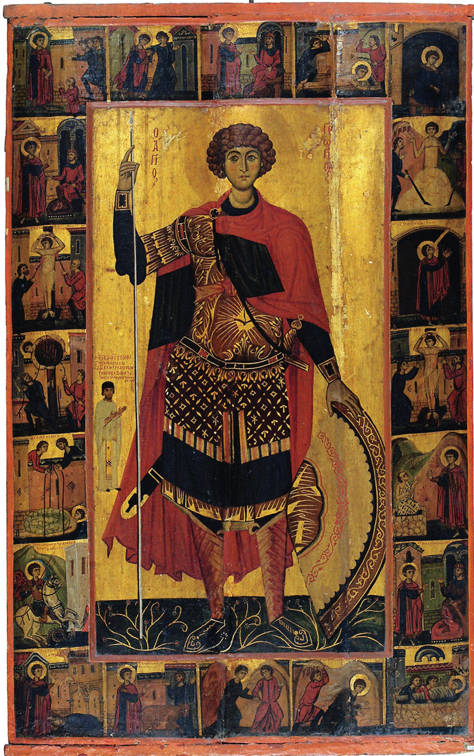
Εικ. 19. Ο άγιος Γεώργιος με σκηνές από τον βίο του, αρχές 13ου αι. Σινά, Ιερά Μονή Αγίας Αικατερίνης.