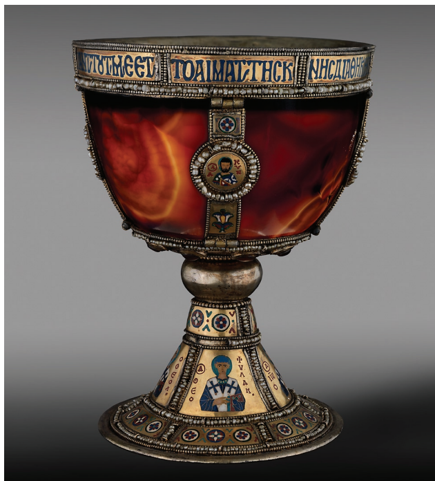
Εικ. 8. Ποτήριο των Πατριαρχών από σαρδόνυχα και σμάλτο, 10ος - αρχές 11ου αι. Βενετία, Βασιλική Αγίου Μάρκου, Θησαυροφυλάκιο, αρ. ευρ. 40.