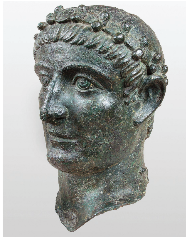
Εικ. 3. Κεφαλή χάλκινου αγάλματος του Μεγάλου Κωνσταντίνου, 325-330. Βελιγράδι, Εθνικό Μουσείο, αρ. ευρ. 79-IV.

Στους συντελεστές της επιτυχίας προσγράφονται όμως και άλλοι παράγοντες. Ο ενθουσιασμός, για παράδειγ-