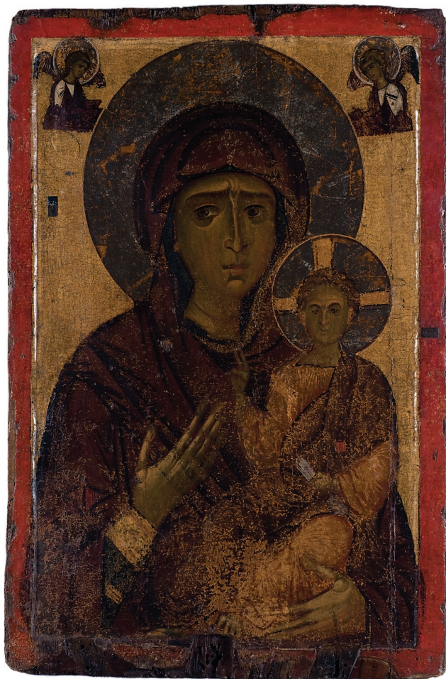
Εικ. 15. Αμφιπρόσωπη εικόνα με την Παναγία Οδηγήτρια και τον Χριστό Άκρα Ταπείνωσι , τέλη 12ου αιώνα. Καστοριά, Βυζαντινό Μουσείο.