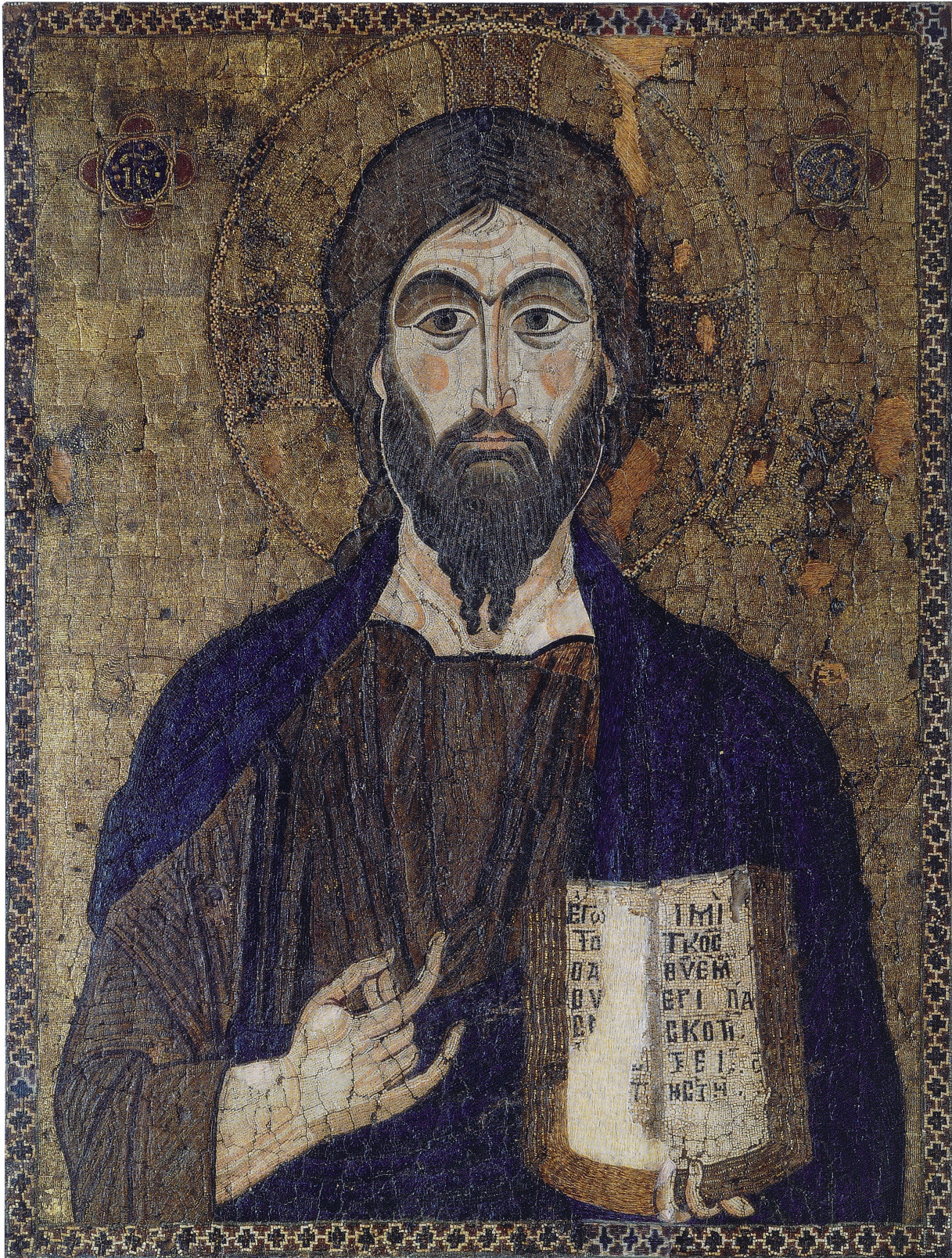
Εικ. 14. Ψηφιδωτή εικόνα με παράσταση του Χριστού Παντοκράτορα, 1150-1175. Φλωρεντία, Museo Nazionale di Bargello, αρ. ευρ. 3.