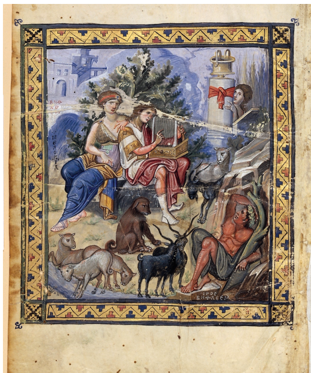
Εικ. 9. Ψαλτήριο, μέσα 10ου αι. Παρίσι, Εθνική Βιβλιοθήκη της Γαλλίας, κώδικας Par. gr.139.