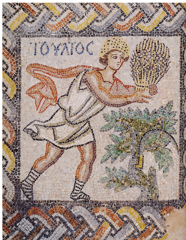
Εικ. 4. Ο μήνας Ιούλιος. Λεπτομέρεια ψηφιδωτού δαπέδου με προσωποποιήσεις των μηνών από τη Θήβα, πρώιμος βος αι. Χαλκίδα, 23η Εφορεία Βυζαντινών Αρχαιοτήτων.

θεσης, δεν μπορεί παρά να στηρίζεται στη χρονολογική διαδοχή των καλλιτεχνικών γεγονότων, ταυτόχρονα όμως και να αρθρώνεται επάνω σε ορισμένα θεμελιακής φύσης αποδεικτικά στοιχεία. Σε απολύτως αντιπροσωπευτικά, δηλαδή, παραδείγματα από τις επιμέρους κατηγορίες των έργων της τέχνης, οι οποίες εκπροσωπούνται εκφράζοντας παραστατικά τις κατά καιρούς τάσεις των μορφοποιητικών αναζητήσεων. Πρέπει ακόμα να συμπεριλαμβάνει τις πιο εύγλωττες μαρτυρίες για τις επιρροές που δέχθηκε η εκφραστική ανάγκη, αλλά και όσες αλλαγές επέφερε ο εκάστοτε αναπροσανατολισμός των μορφολογικών κατευθύνσεων. Να αξιοποιεί, συνεπώς, δυναμικά πολλά ειδικότερα επιστημονικά ζητήματα σχετικά με το νόημα και τη λειτουργία των εκθεμάτων. Κάπως έτσι συγκροτήθηκαν οι εννέα ενότητες των αντικειμένων της έκθεσης, διαμορφώνοντας αντίστοιχα τα εννέα ξεχωριστά κεφάλαια μιας ενιαίας όμως διήγησης γύρω από τα ιστορικά και τα πολιτισμικά συμβάντα των βυζαντινών αιώνων.