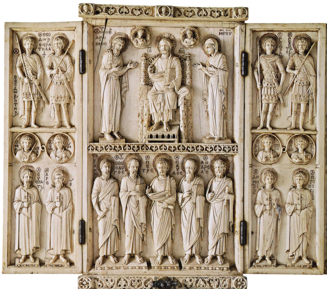
Εικ. 7. Παράσταση Δεήσεως με αγίους από το ελεφαντοστέινο τρίπτυχο Harbaville, μέσα 10ου αι. Παρίσι, Μουσείο Λούβρου - Τμήμα Έργων Τέχνης, αρ. ευρ. OA 3247.

και ορισμένα κοσμικά σκεύη αργυροχοΐας με μυθολογικά θέματα, χριστιανικά σύμβολα και βιβλικές σκηνές. Έργα, όπως το κιβωτίδιο της Projecta (εικ. 10) ή κάποια αντίστοιχα από τους θησαυρούς της Κύπρου και της Μυτιλήνης, με την τεχνική, τη μορφολογία και το διακοσμητικό τους πνεύμα, αισθητοποιούσαν και πάλι τις οφειλές του Βυζαντίου στην καλλιτεχνική παράδοση των ελληνιστικών χρόνων. Ανάμεσα σε πολλά άλλα χρυσοχοϊκά αριστουργήματα (εικ. 11), βρήκαν εδώ τη σωστή τους θέση μια μεγάλη αλυσίδα στήθους από το Βρετανικό Μου-