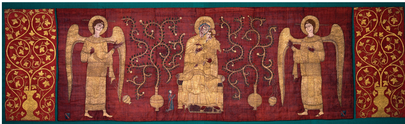
Εικ. 17. Μεταξοκέντητο ταφικό ύφασμα από την Κύπρο, τέλη 13ου αι. Βέρνη, Ιστορικό Μουσείο.