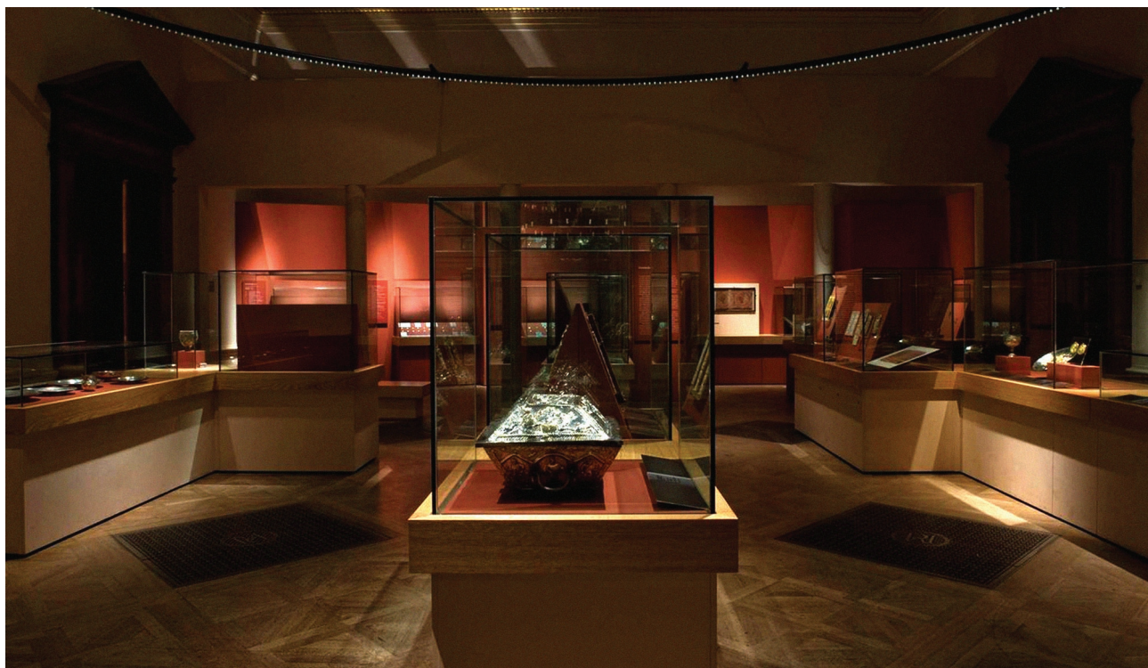
Εικ. 1. Η Royal Academy of Arts την ημέρα των εγκαινίων της έκθεσης Byzantium 330-1453 .