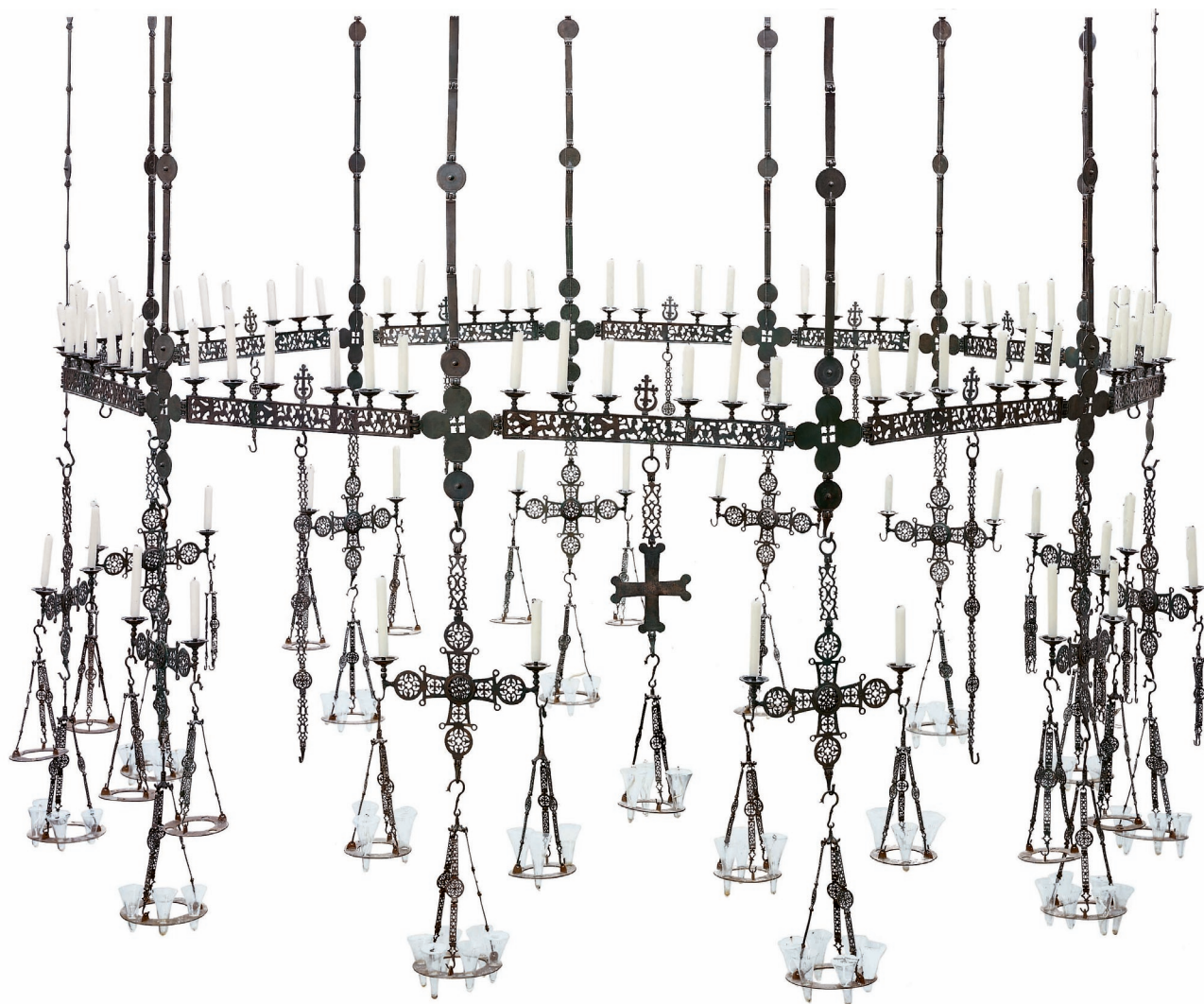
Εικ. 13. Χάλκινος «χορός» με πολυκάνδηλα, 13ος-14ος αι. Μόναχο, Archäologische Staatssammlung.

Θήβα. Εδώ ήταν εκτεθειμένο το πασίγνωστο επίχρυσο ομοίωμα μιας εκκλησίας του 12ου αιώνα από τον θησαυρό του Αγίου Μάρκου της Βενετίας, παραπέμποντας τους επισκέπτες στον φημισμένο ναό των Αγίων Αποστόλων της Κωνσταντινούπολης, αλλά και στην αρχιτεκτονική των εκκλησιών εκείνης της εποχής γενικότερα. Στον ίδιο χώρο ήταν συγκεντρωμένα εκθέματα σχετικά με τη λειτουργία: εκκλησιαστικά σκεύη, σταυροί λιτανείας (εικ. 12) και χειρόγραφα ιερών κειμένων, εγκόλπια με πολύτιμους λίθους και σμάλτα, κεντήματα, όπως ο γνωστός επιτάφιος του Victoria & Albert Museum και μια καμπάνα από το Ρεέ. Στην ενότητα αυτή έπρεπε να ενταχθεί κανονικά και ο μεγάλος «χορός» του Μονάχου με τα